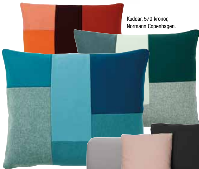
Kuddar, 570 kronor, Normann Copenhagen.