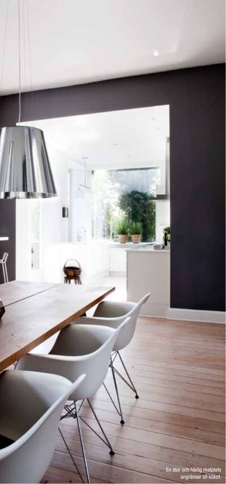
En stor och härlig matplats angränsar till köket.