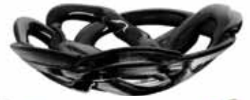
Skål, 549 kronor, Kosta Boda.