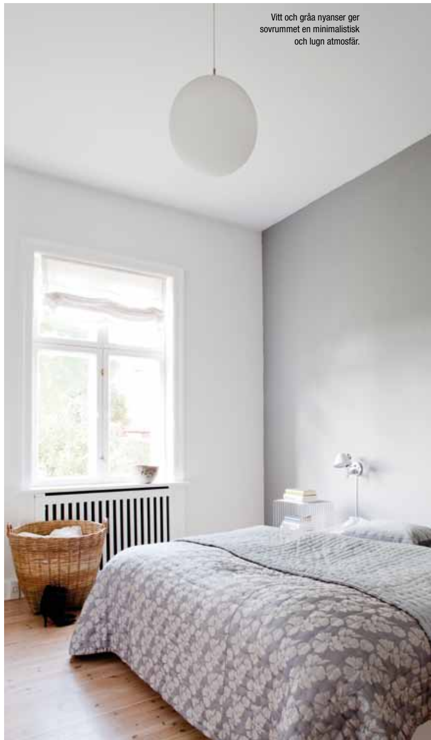
Vitt och gråa nyanser ger sovrummet en minimalistisk och lugn atmosfär.