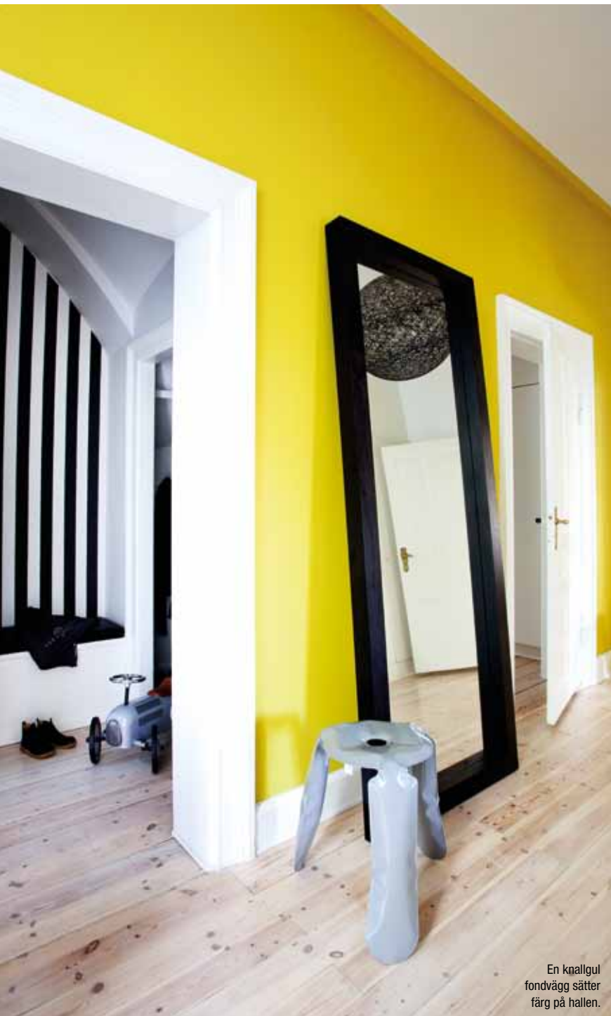
En knallgul fondvägg sätter färg på hallen.