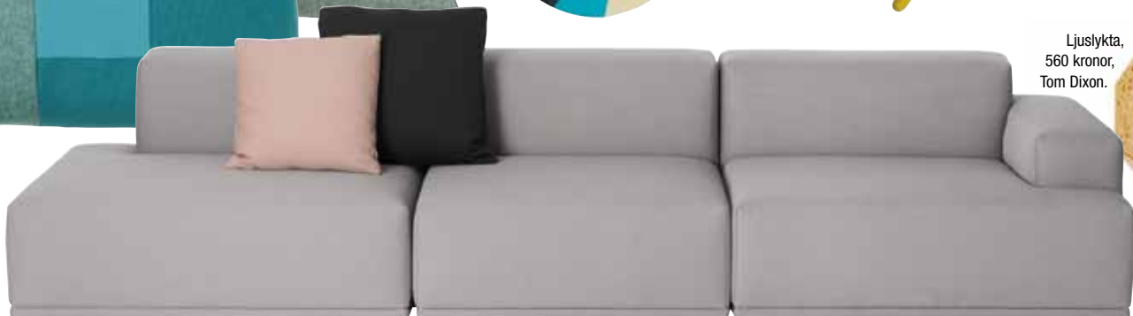
Soffa, 28 000 kronor, Muuto.