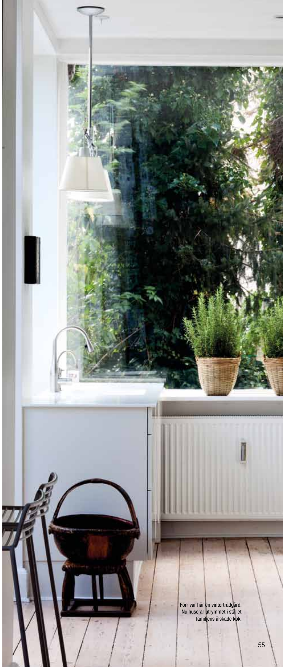
Förr var här en vinterträdgård. Nu huserar utrymmet i stället familjens älskade kök.