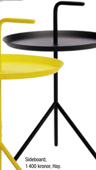
Sideboard, 1 400 kronor, Hay.