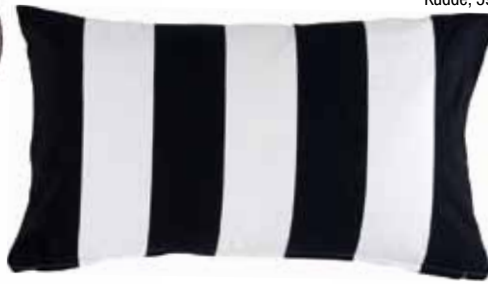
Kudde, 59 kronor, Jotex.