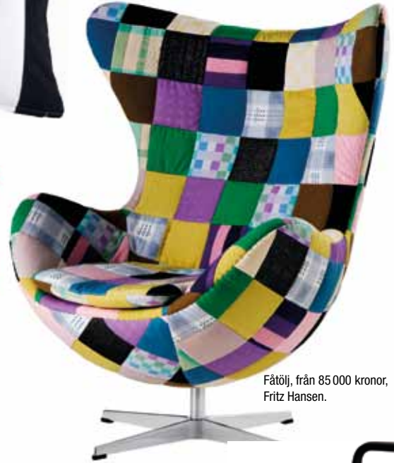
Fåtölj, från 85 000 kronor, Fritz Hansen.