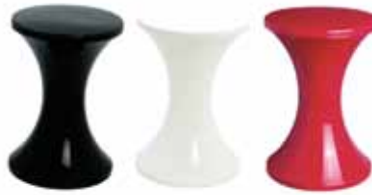
Pall, 375 kronor, Designtorget.