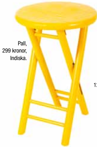
Pall, 299 kronor, Indiska.