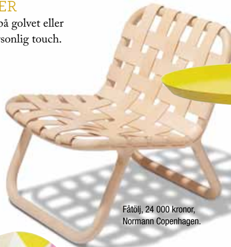
Fåtölj, 24 000 kronor, Normann Copenhagen.

Accenter i klara kulörer, antingen på fondväggar eller på möblerna, blir vitaminkickar i hemmet.