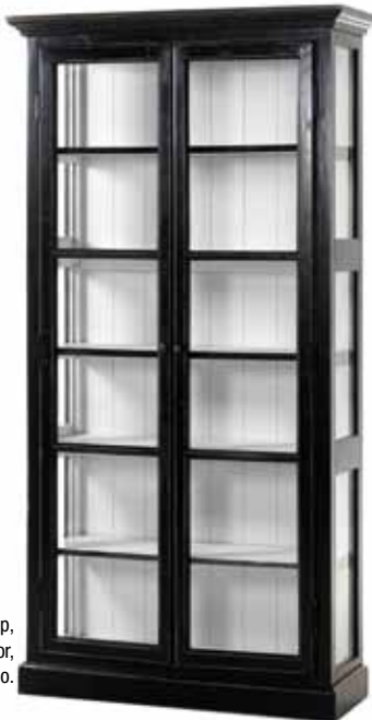
Vitrinskåp, 8 990 kronor, Mio.